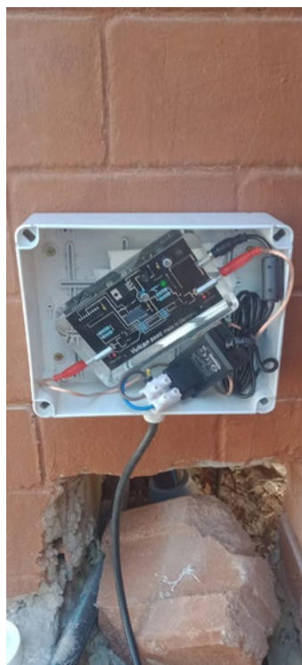
沃肯5000安装在保护箱中