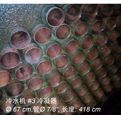
冷水机 #3 冷凝器 Ø 67 cm, 管 Ø 7/8", 长度: 418 cm