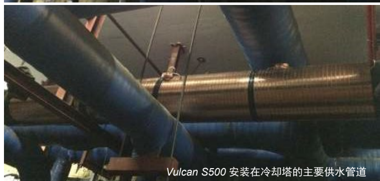
Vulcan S500 安装在冷却塔的主要供水管道