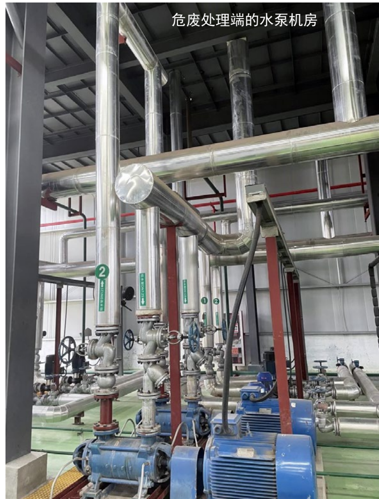
危废处理端的水泵机房