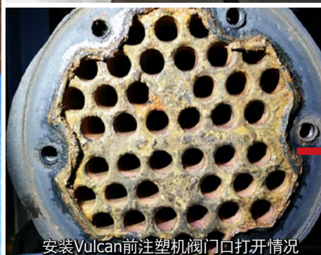
安装Vulcan前注塑机阀门口打开情况