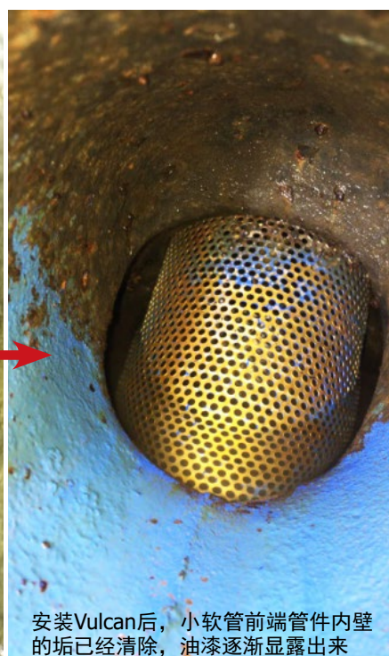
安装Vulcan后，小软管前端管件内壁的垢已经清除，油漆逐渐显露出来