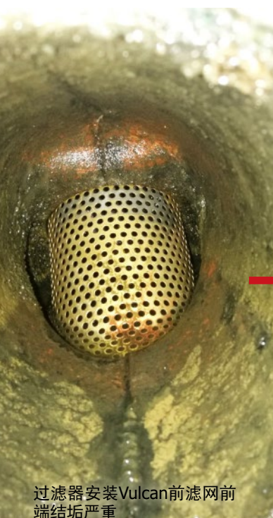
过滤器安装Vulcan前滤网前端结垢严重