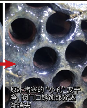
原本堵塞的“小孔”变干净，阀门口锈蚀部分逐渐消失