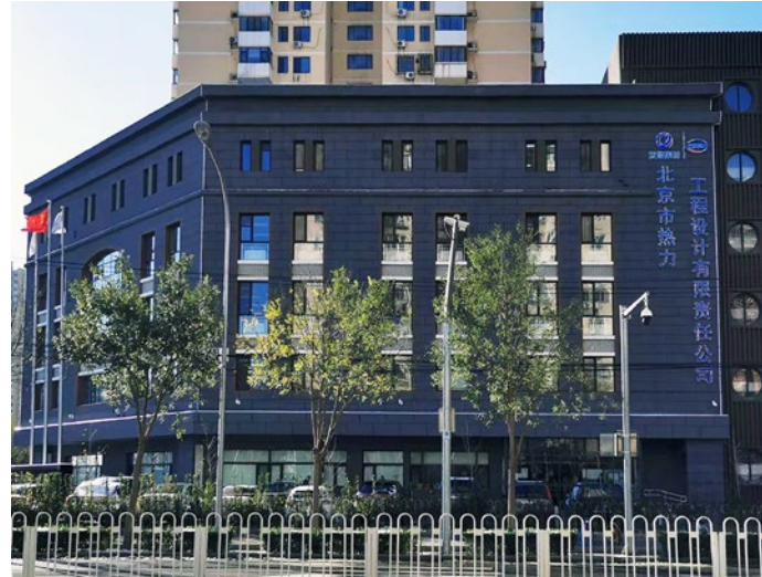
北京市热力工程设计有限责任公司