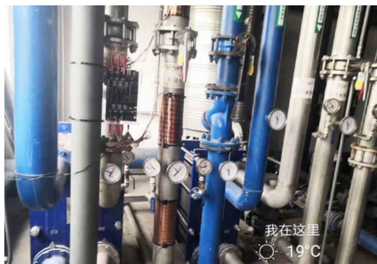
Vulcan S100 安装在回温机前面