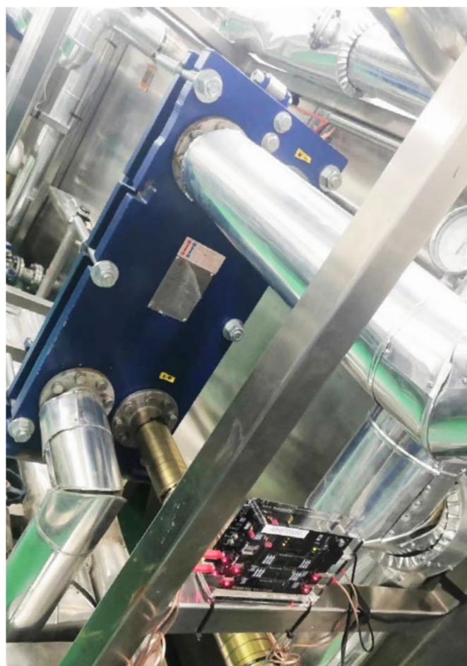
Vulcan S50 安装在杀菌机前面

上海百岳特，为 大江生医股份有限公司 的子公司之一。上海百岳特为专业功能性食品及护肤品开发及代加工厂商，目前有多种创新性产品，包含功能性食品(口服液、固体饮料、片剂、胶囊)与护肤品(面膜、精华素等)。