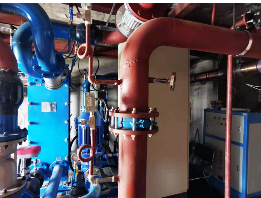
Vulcan S100 预防板式换热器结垢 第1步：安装脉冲带