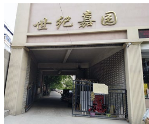
世纪嘉园小区门口