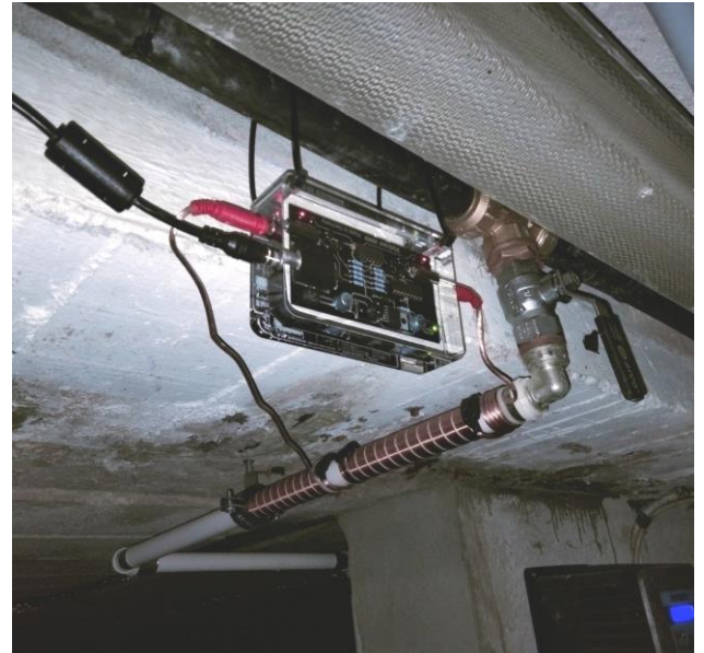
Vulcan 3000 直径 为25 毫米的储水管