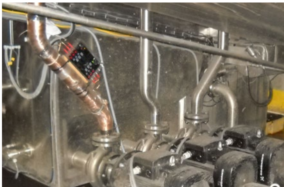
安装在产品清洗系统上的Vulcan S100装置

确认了沃肯(Vulcan)的有效性之后，我们在芝加哥 IFCO 工厂内的5个清洗站全都安装了S100装置。