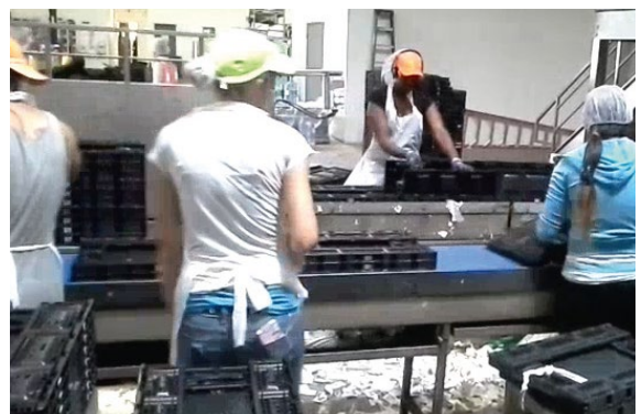
容器从产品清洗系统中出来