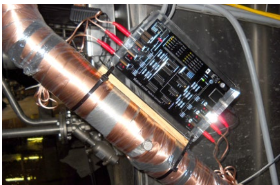
安装在产品清洗系统上的Vulcan S100装置