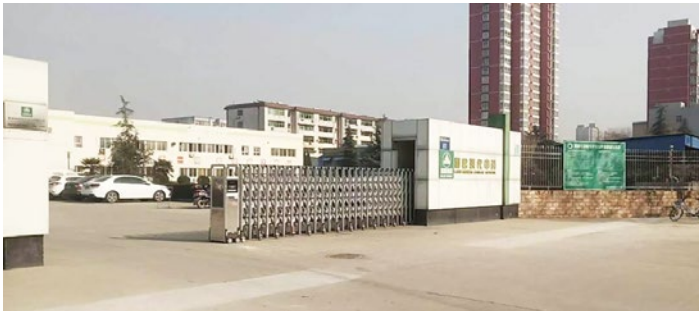
陕西利君现代中药厂区

利君中药具有300多年的悠久历史，公司前身为“恒心堂药庄”，始创于明朝末期，现今则专门从事中成药研发、生产、销售。