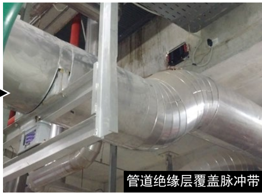
管道绝缘层覆盖脉冲带