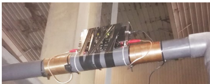
安装在反渗透膜前的S10