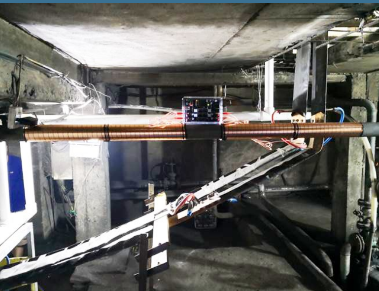
Vulcan S50 安装在西工厂