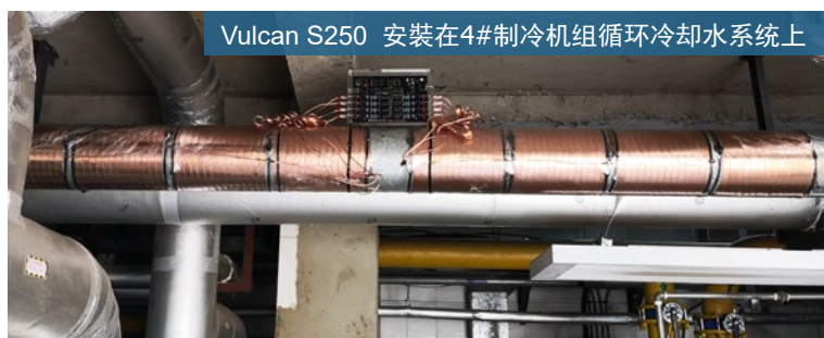
Vulcan S250 安装在4#制冷机组循环冷却水系统上