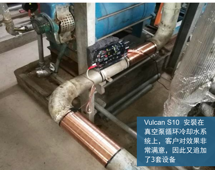
Vulcan S10 安装在真空泵循环冷却水系统上，客户对效果非常满意，因此又追加了3套设备