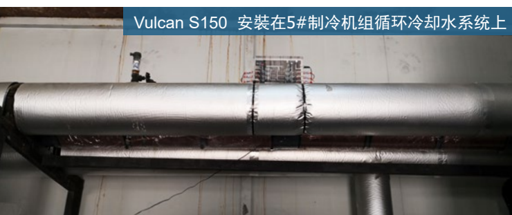
Vulcan S150 安装在5#制冷机组循环冷却水系统上