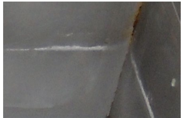
安装沃肯 (Vulcan) 之前- 仅三周后, 不锈钢上就会出现钙化线。

因此, Vulcan3000和Vulcan5000的安装成功地解决了这一硬垢积聚难题。