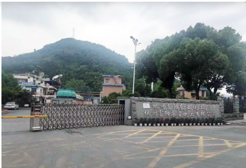
杭州富阳永星化工有限公司, 主营业务为化工原料生产及销售。