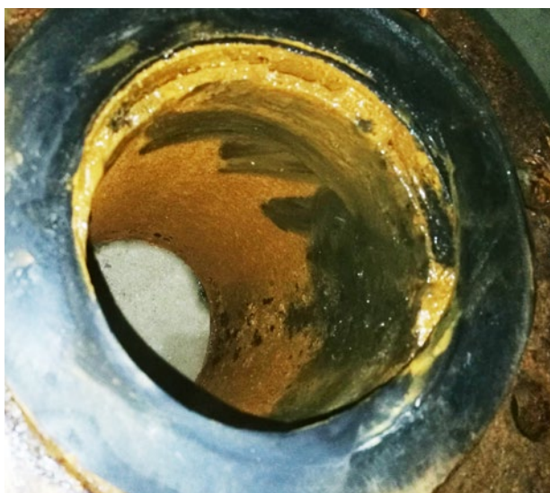
水垢轻轻一擦就掉，露出阀体光滑内壁

钰桥中央庭院小区位于大连市甘井子区，总建筑面积约16万平方米，小区总居住户数约1300户，人口约3900人。