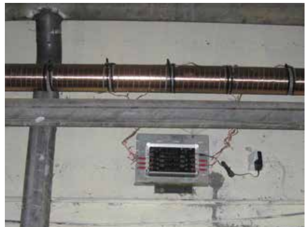
Instalación de Vulcan S100