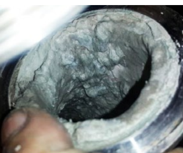
Antes de la instalación de Vulcan: la tubería estaba llena de incrustaciones.