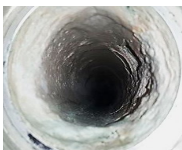
2 semanas después de la instalación de Vulcan, las incrustaciones se habían ablandado y desprendido.