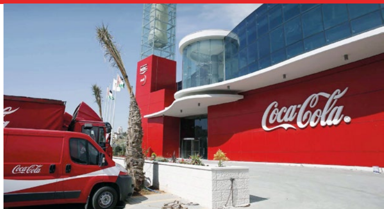
Fábrica de Coca-Cola en Marrakech, Marruecos.