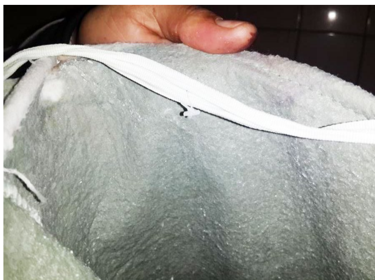
48 horas después de la instalación de Vulcan, el filtro sigue limpio.