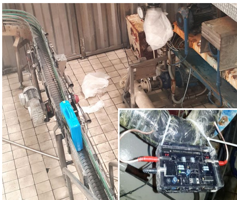
Vulcan 5000 se instaló en la entrada de agua del cuarto de reciclaje de agua.