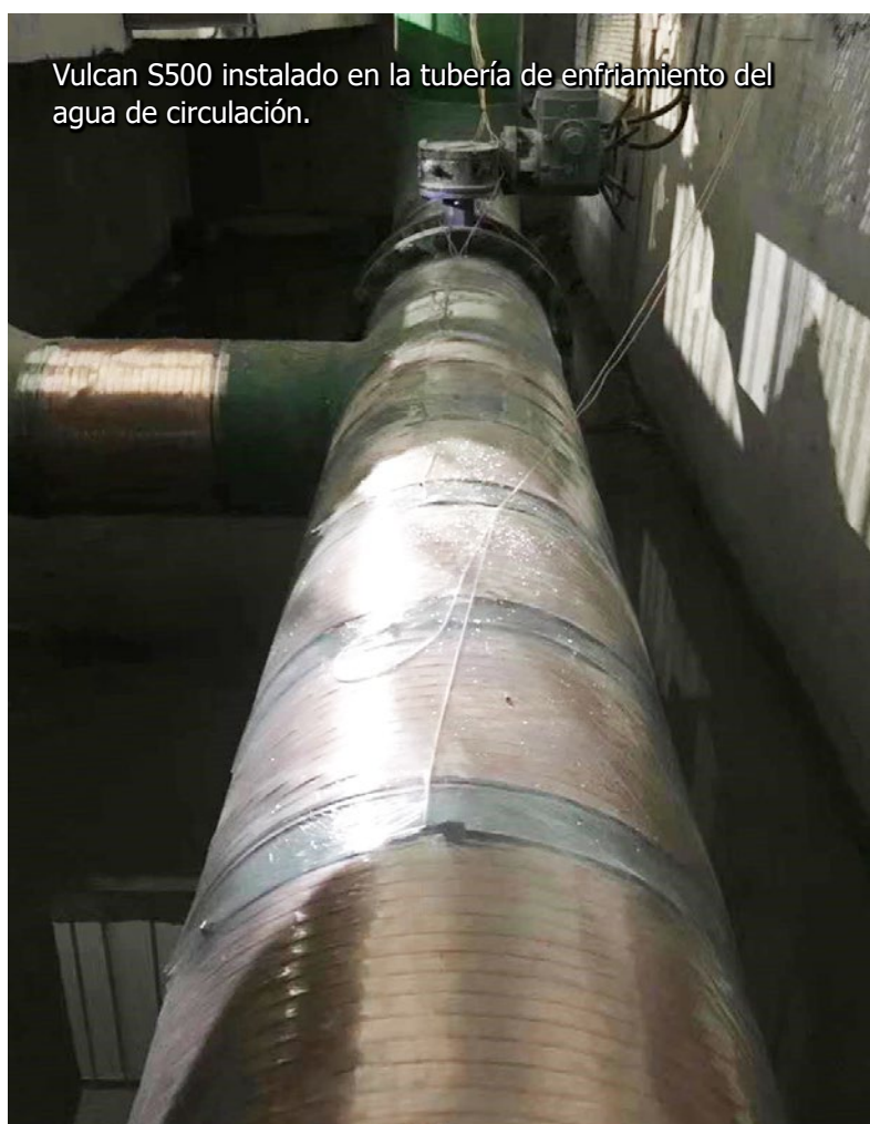
Vulcan S500 instalado en la tubería de enfriamiento del agua de circulación.

Actualmente Sinoway posee y opera dos plantas, una situada en la Provincia de Shandong y la otra en la Provincia de Jiangsu.